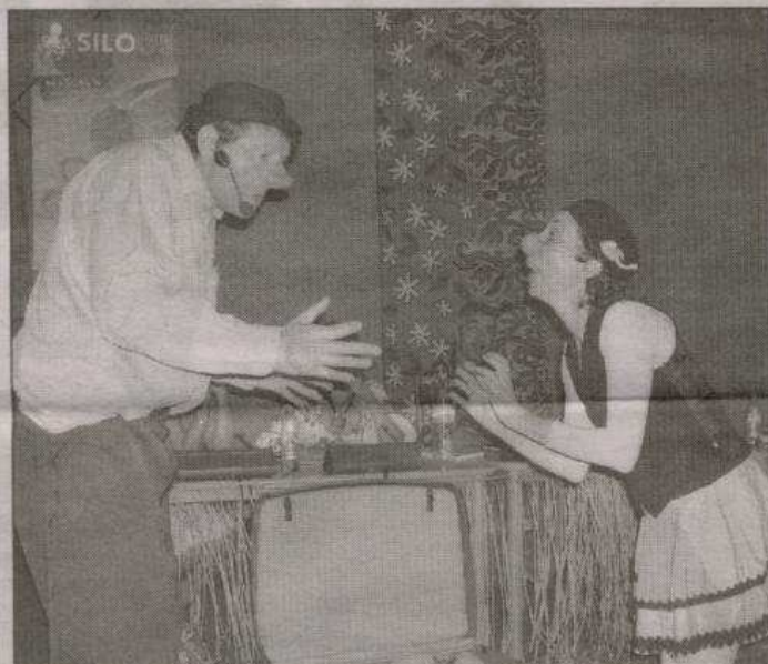
Salle comble et rires aux larmes assurés en fin de débats, avec les Bataclowns.