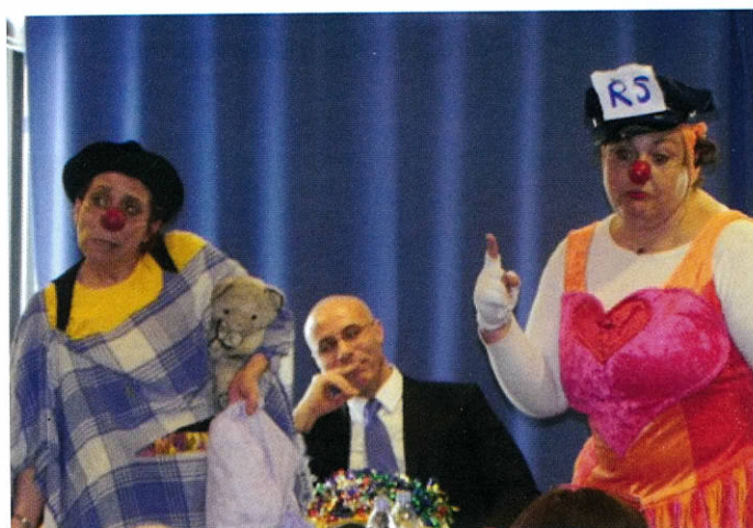
Les Bataclowns en pleine action