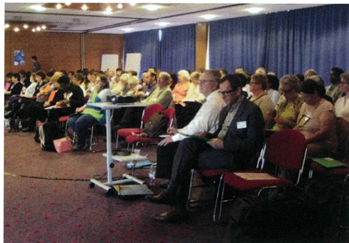
La salle écoutant les débats

Après déjeuner, la deuxième table ronde nous a par contre interpellés sur l'évolution des besoins des familles et des personnes. Cette évolution interroge bien entendu nos pratiques professionnelles, mais elle interroge aussi les cadres réglementaires d'intervention que nous imposent nos financeurs. Que faudrait-il faire pour prendre en compte ces évolutions de telle sorte que nos interventions soient toujours plus pertinentes ?