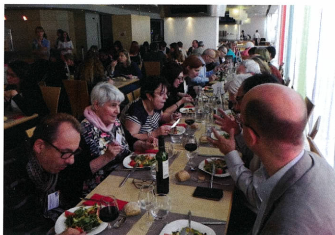
Un repas convivial pris entre deux tables rondes